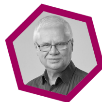
prof. dr hab. Jerzy Hausner