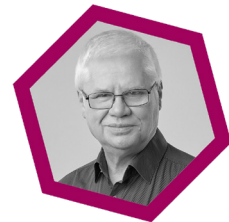
prof. dr hab. Jerzy Hausner Przewodniczący Rady Programowej Open Eyes Economy Summit, Profesor Honorowy Uniwersytetu Ekonomicznego w Krakowie