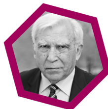
prof. dr hab. Adam Daniel Rotfeld Minister Spraw Zagranicznych w 2005 r.

Prof. dr hab. Adam Daniel Rotfeld, były minister spraw zagranicznych w rządzie Marka Belki (2005); dyrektor Międzynarodowego Instytutu Badań nad Pokojem w Sztokholmie (SIPRI, 1989-2002); osobisty przedstawiciel Przewodniczącego KBWE z mandatem przygotowania politycznego rozwiązania konfliktu na lewym brzegu Dniestru (1992-93); wieloletni członek Kolegium Doradczego Sekreta-